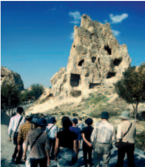
Im Göreme Open Air Museum

die alten geometrischen Muster in roter Farbe erkennen, und auch hier taucht wieder ein Fresko mit der Darstellung Georgs und Theodors im Kampf mit einem reptilienartigen Drachen auf – daher übrigens auch der Name der Kapelle. Beachtenswert ist das Fresko mit den Heiligen Basilus, Thomas und Onuphrius – Letzterer, übrigens Schutzpatron der Stadt München, steht nackt, mit stattlichem Bart und weiblicher Statur samt Brüsten vor einer Palme. Zu dieser seltsamen Figur gibt es mehrere Legenden. Es heißt, Onuphrius sei eine Frau gewesen und zwar von so hinreißender Schönheit, dass sie sich wünschte, Gott möge sich ihrer erbarmen und sie vor den Nachstellungen der Männer schützen. Gott kam ihrem Wunsch nach, entstellte ihr zum Schutze das Gesicht und ließ ihr einen Bart wachsen. Bössere Zungen behaupten, Onuphrius sei als Frau eine hemmungslose Sünderin gewesen und habe Gott