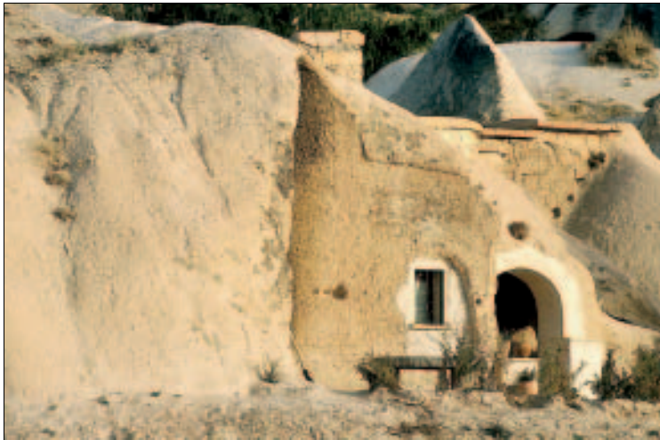
Wohnen im Tuffstein