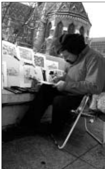
Maler im Burgviertel

Auskünfte zu Festen, Konzerten und Veranstaltungen auf dem Burgberg erteilt Budavár Info , I. Bezirk, Szentháromság tér, ☎ 4880475, § 4880473, var@budapestinfo.hu. Geöffnet Juni–September 9–21 Uhr, Oktober–Mai 9–19 Uhr.