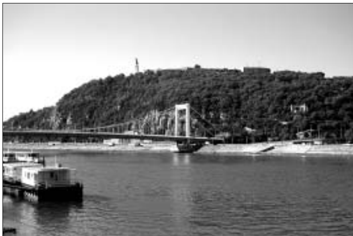
Elisabethbrücke, Gellértberg und Befreiungsdenkmal

Der Aufstieg über die Serpentina an der Nordflanke des Gellértberges von der Elisabethbrücke aus dauert etwa zwanzig Minuten. Mit dem Auto kommt man vom Westen herauf (Szirtes út). Außerdem kann man mit der Buslinie 27 ab Móricz Zsigmond körtér fahren.