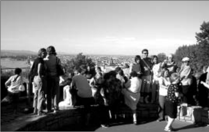
Von der Zitadelle aus reicht der Blick weit über Budapest

Dominierendes Bauwerk auf dem Gellértberg ist die mächtige, mittelalterlich wirkende Zitadelle . Tatsächlich entstand sie aber erst nach der Niederschlagung des ungarischen Freiheitskampfes von 1848/49. Die Habsburger bemühten sich damals, mit Kanonen, die sie von hier aus auf die Hauptstadt richteten, die Treue und Ergebenheit ihrer ungarischen Untertanen zu erzwingen. Verständlicherweise stießen sie damit auf wenig Gegenliebe und mussten 1897 schließlich, dem starken Druck der Öffentlichkeit nachgebend, die Zitadelle den Budapester Stadtvätern übergeben.