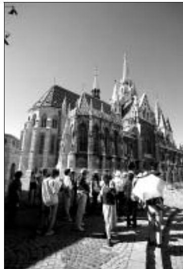
Die Matthiaskirche im Burgviertel

Auch das Habsburger Herrscherhaus würdigte den historischen Schauplatz durch die Krönung der Könige Franz Joseph I. (1867) und Karl IV. (1916). Aus Anlass der Inthronisation des ersteren wurde hier am 8. Juni 1867 die Krönungsmesse von Franz Liszt uraufgeführt. Das Innere der imposanten Kirche birbt vor Kunstschätzen und Touristen. Kein Fleck, der nicht mit Fresken bedeckt oder mit Ornamenten verziert ist. Rechts vom Hauptaltar führt eine Treppe in