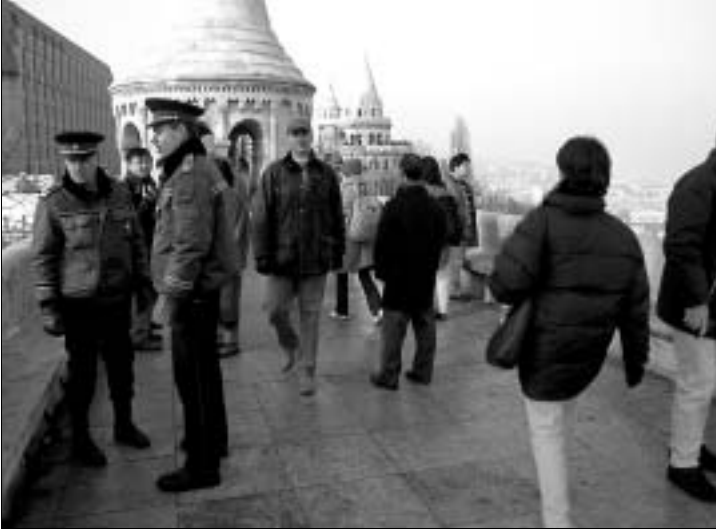
Auf der Fischerbastei

Budapest Karten S. 134/135, 208/209; 224/225 u. 239