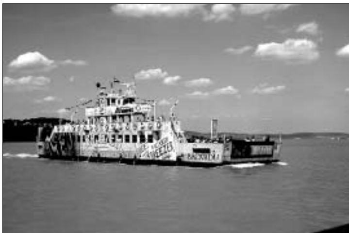
Autofähren verbinden die Halbinsel Tihany mit Szántód am Südufer

An der Südspitze der Halbinsel befindet sich der Autofährhafen , der an der schmalsten Stelle des Plattensees Nord- und Südufer miteinander verbindet. Die gesamte Personenschiffahrt geht vom inneren Hafen aus, der zwischen Dorf und Fährhafen am östlichen Ufer liegt.