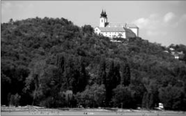
Am Balaton meistbesucht: die Abteikirche von Tihany

stark verblassten Fresken ins Auge. Hier befindet sich außerdem eine kleine Sammlung sakraler Gegenstände (u.a. Mönchskleidung, Kreuze, Kelche, Hostiendose).