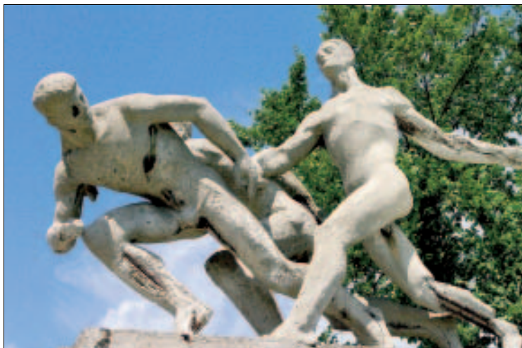
Staffelläufer vorm Nationalstadium

Doch das alles scheint Geschichte zu sein. Der 2008 begonnene Abriss des Stadions und der rund 300 Millionen Euro teure Neubau bringen neue Nüchternheit in die Umgebung, wenngleich die in den polnischen Nationalfarben gehaltene Arena mit 55.000 Sitzplätzen zu den architektonisch schönsten Stadien Europas zählen wird. Bis Mitte 2011 werden die Bauarbeiten beendet sein, bis dahin kann man sich im Pavillon anhand eines Stadionmodells ein Bild machen. Die offizielle Einweihung folgt im November 2011 mit einem Länderspiel gegen den Wunschgegner, Deutschlands Nationalelf. Ein halbes Jahr nach dieser Eröffnung werden