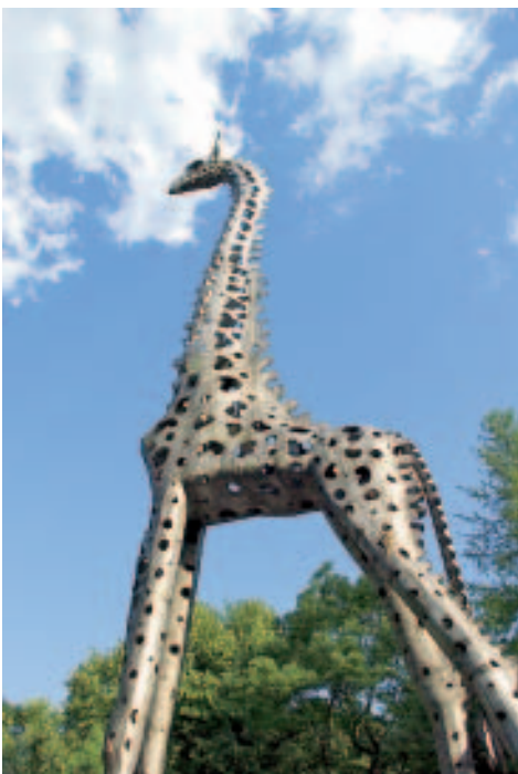
Giraffe auf dem Weg zum Zoo

Pragas älteste, 1640–1644 erbaute Kirche war ursprünglich nur eine Kapelle des Bernhardiner-Ordens, dessen mächtiges Kloster sich ebenfalls in ba-