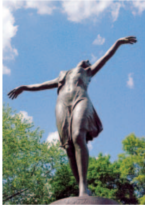
Skulptur im Skaryszewski-Park

Der Markt gilt als Überbleibsel des alten Warschaus, gehandelt wird hier wie vor 100 Jahren, und einige Marktfrauen scheinen auch so gekleidet zu sein. Ge-