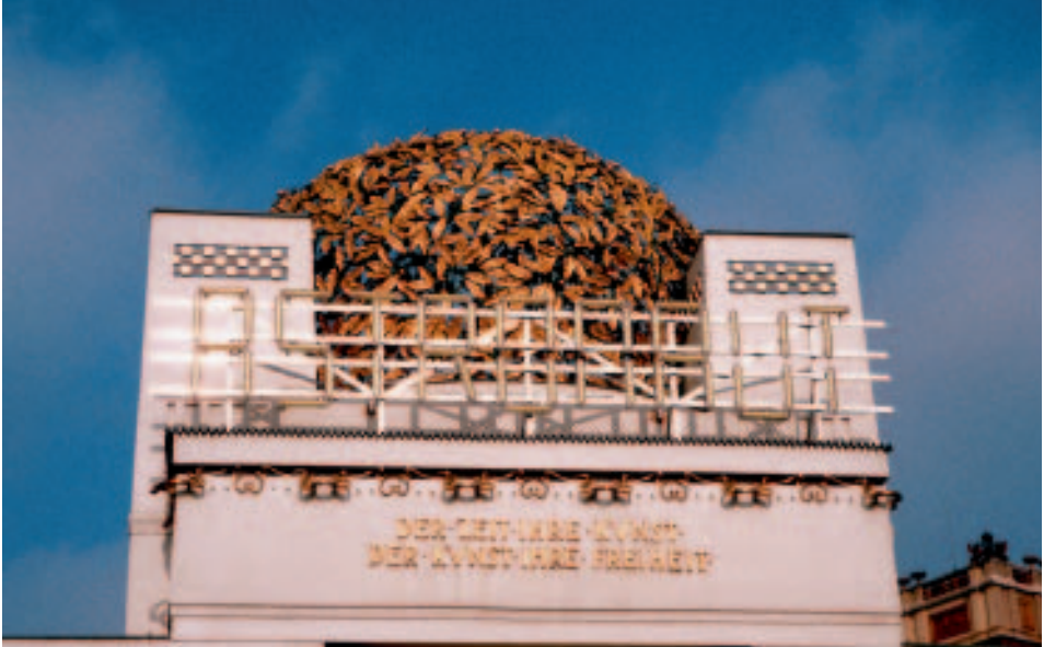
„Mutterhaus“ des Wiener Jugendstils: Secession