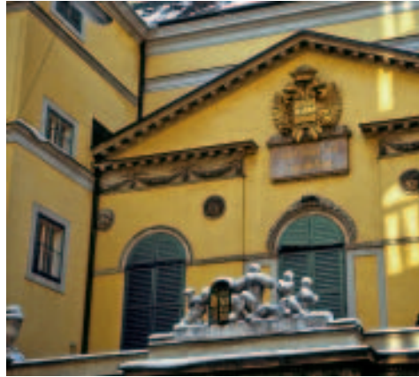
Historische Theaterfassade (Theater an der Wien, Millöckergasse)

Unter der Intendanz von Peter Weck (ab 1983) wurden sogar Eigenproduktionen auf die Bühne gebracht und Weltpremieren gefeiert. Seit 1987 agiert das Haus im Verbund mit dem Raimund-Theater und dem Ronacher unter dem Label Vereinigte Bühnen Wien . Anlässlich Mozarts 250. Geburtstag im