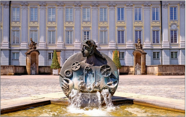
Hohenzollernresidenz: Blick auf die Fassade