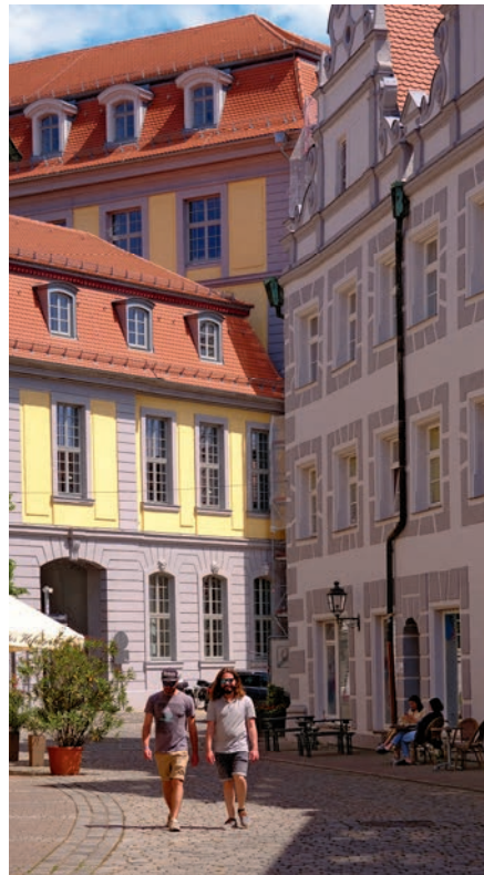
In der barocken Altstadt

Der in der ersten Hälfte des 18. Jh. nach französischem Muster angelegte Hofgarten ist – neben den Auen der Fränkischen Rezat – die wichtigste Ruhezone der Stadt. Architektonischer Blickfang ist die Orangerie im barocken Stil, die für Konzerte und Tagungen genutzt wird. Ganz in der Nähe des Gebäudes verweist ein unscheinbarer Gedenkstein auf den Ort, an dem Kaspar Hauser (→ „Edler Wilder ...“, S. 48) die tödliche Stichverletzung erlitt. Die lateinische Inschrift heißt übersetzt: „Hier wurde ein Geheimnisvoller auf geheimnisvolle Weise getötet“. Ein kleines Juwel am Rand des Hofgartens ist der 2001 nach historischen Vorbildern angelegte Kräutergarten . Er erinnert an den berühmten Botaniker und Arzt Leonhart Fuchs (1501–1566), der dem Ansbacher Markgrafen fünf Jahre als