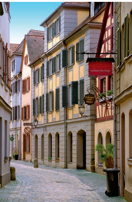
Platenstraße: Geburtsort eines Dichters

Gegenüber der barocken Planstadt mit ihren schnurgeraden Straßen weist die zwischen Residenz, Promenade und Fluss gelegene Altstadt eine typisch mittelalterliche Struktur mit krummen Gassen und Häusern aus unterschiedlichen Epochen auf. Sehenswert hier sind v. a. die beiden Kirchen, deren charakteristische Türme der Ansbacher Stadtsilhouette ein unverwechselbares Outfit verleihen. Einziges erhaltenes Stadttor ist das Herrieder Tor, durch das im Mittelalter und in der frühen Neuzeit die Ausfallstraße nach Herrie-