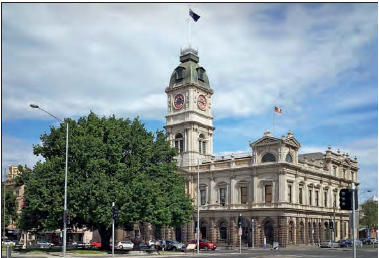
Das Rathaus von Ballarat

Besucher kommen v. a. wegen der Sehenswürdigkeiten, allen voran das Museum of Australian Democracy at Eureka und das Sovereign Hill . Die Universitätsstadt punktet aber auch mit ausgezeichneten Restaurants, trendigen Cafés und einer kreativen Kunstszene. Aushängeschild ist die ausgezeichnete Ballarat Fine Art Gallery . Am besten erkundet man die Stadt zu Fuß, in der Touristinformation gibt es Infos zu den Ballarat Heritage Walks .