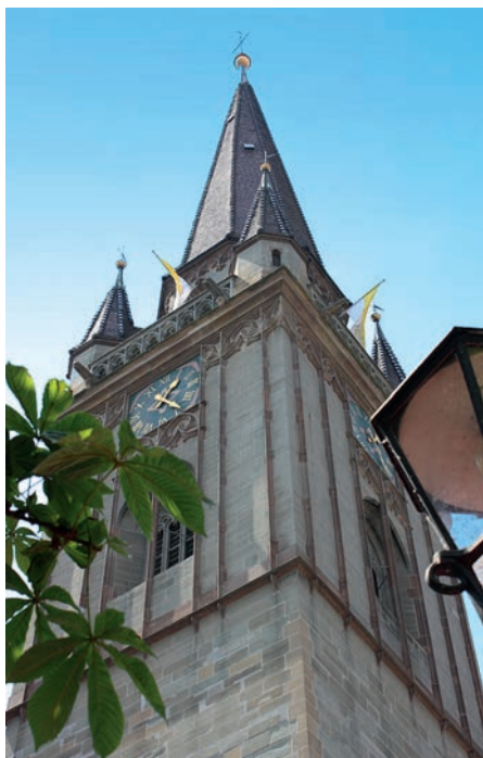
Radolfzeller Münster: gotisches Schmuckstück