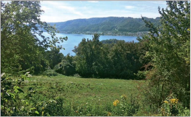
Von Spittelsberg überblickt man den Überlinger See

geht es auf dem Fußweg mit blauer Raute Richtung Bodman-Ludwigshafen, am Abzweig beim Sendemast 2 gehen wir auf dem uns bereits bekannten Weg zum See hinab und zum Parkplatz, an dem wir unsere Tour begon-