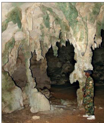
Ein Schloss für Fledermäuse