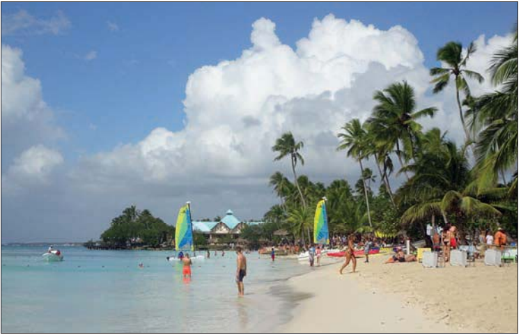
Playa Bayahibe – bestens geeignet zum Schwimmen und Relaxen