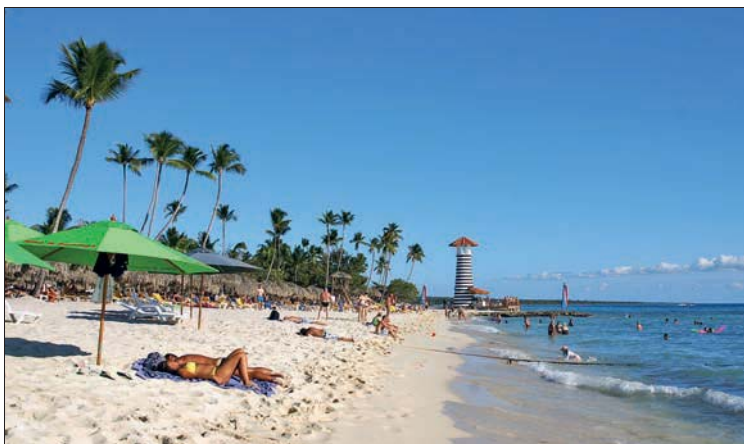
Playa Dominicus – hier reihen sich inzwischen nahtlos die Resorts ...

(Ranger) ist ratsam. Die mit Taino-Zeichnungen besonders schön verzierte Cueva José María ist für die Öffentlichkeit nicht zugänglich. Ausflugsziel Nummer eins ist aber die Insel Sana, die täglich mit Schnellbooten von allen Hotels aus angelaufen wird. Zwischen Festland und Insel befinden