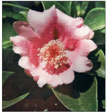
Nationalblume „Rose von Bayahibe“

Nachtleben/Trinken Colmado Billy , der Platz in der Ortsmitte vor dem Supermarkt