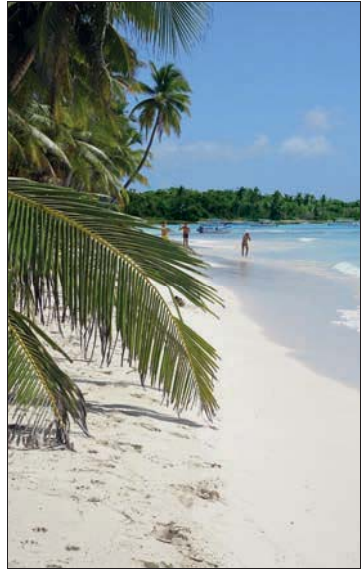
Puderezuckerstrand auf Saona