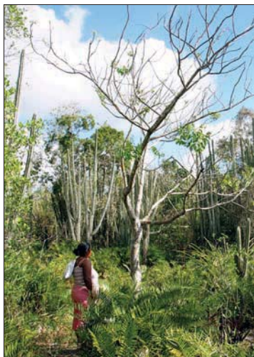
Grüner Lehrpfad: Padre Nuestro

Kurz nach dem Startpunkt 1 an der Hauptstraße (ausgeschildert Padre Nuestro) passiert man eine Schranke 2