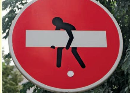
Werke des Streetart-Künstlers A. Clet

■ Weitere Infos unter: www.tourisme-mulhouse.com/DE/entdecken/top10-das-wesentliche/street-art-allgegenwartig.html .