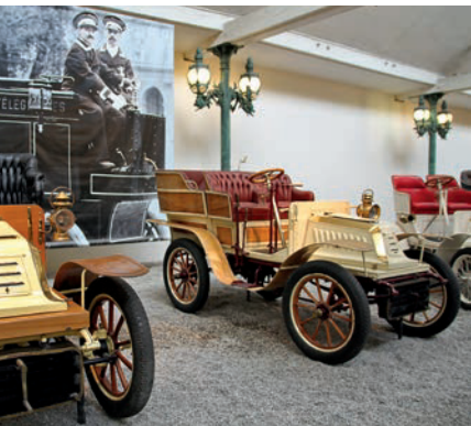
Oldieliehabern geht das Herz auf

My classic Automobile: April bis Sept. tägl. um 11.30 und um 16.30 Uhr, sonst auf Reservierung. Der Preis variiert je nach Modell. Infos unter www.citedelautomobile.com/de/my-classic-automobile .