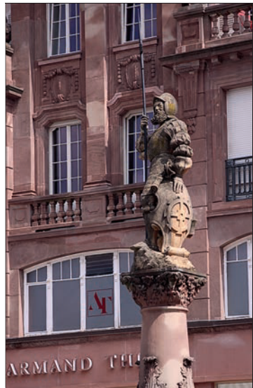
Er überblickt die Place de la Réunion

Temple Saint-Etienne: Beherrscht wird die Place de la Réunion von der protestantischen Stephanskirche, die Mitte des 19. Jh. an der Stelle eines romanischen Gotteshauses aus dem 12. Jh. errichtet wurde. Im Innern führt eine Treppe auf die Galerie, von wo man die wunderschönen Glasfenster aus dem