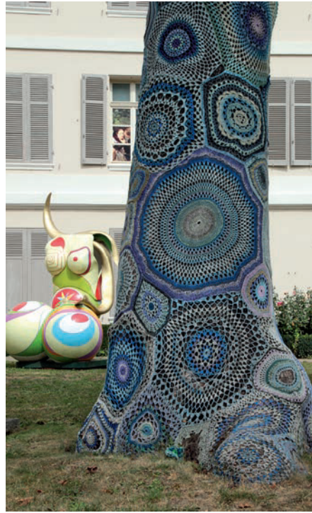
Streetart vor dem Musée des Beaux-Arts

Zeugnisse der Industrialisierung in der Oberstadt: Am Ende der Grand'Rue biegt man rechts und unmittelbar danach wieder links ab in die Rue des Franciscains. In diesem Stadtviertel,