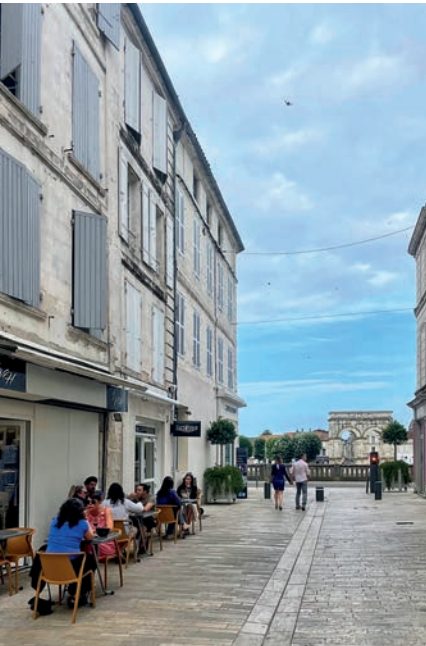
Altstadt und Arc de Germanicus

La Graine d'Orge 8 , beliebtes Lokal mit Biergarten an der Charente, riesige Bierauswahl, mittags und abends kleine Küche (Burger, Croque Monsieur, Pommès), abends oft Konzerte, So/Mo Ruhetag. ☎ 0648480689, bargrain-dorge.fr, Rue Palissy 2 bis. €