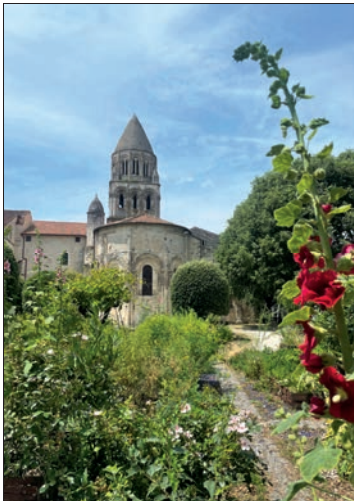
Abbaye aux Dames

Abbaye aux Dames: Bereits im Jahr 1047 wurde auf dem gegenüberliegenden Ufer der Charente das Frauenkloster errichtet, ebenfalls im Stil der Romanik. Erhalten aus dieser Zeit ist nur noch der Glockenturm der Klosterkirche Sainte-Marie in Form eines Tannenzapfens. Das Konventgebäude wurde während der Religionskriege stark beschädigt, im 17. Jh. wiederaufgebaut, später als Gefängnis und während der Revolution als Kaserne genutzt. Im Innenhof sind noch Überreste des alten Kreuzgangs zu sehen. In den 1970er-Jahren erhielt die Anlage ihre heutige Gestalt, seitdem findet hier Mitte Juli das international renommierte Festival de Saintes für klassische Musik statt. Mittlerweile sitzt hier auch die renommierte Musikhochschule der Stadt. Das Gelände ist offen zugänglich. In der Boutique der Abtei werden aufwändig produzierte Audioguides