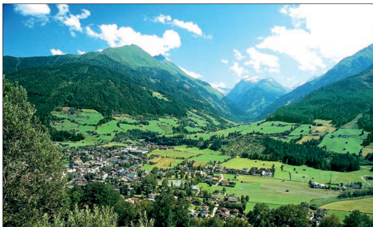
Panoramareiche Fahrt durch das pittoreske Tal der Drau (Kärnten)