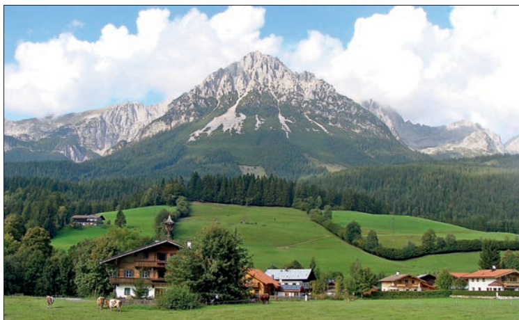
Der Wilde Kaiser (2344 m)

von wo man nach Pontebba im wichtigen Durchgangstal Val Canale auf die Autobahn A 23 und die SS 13 trifft.