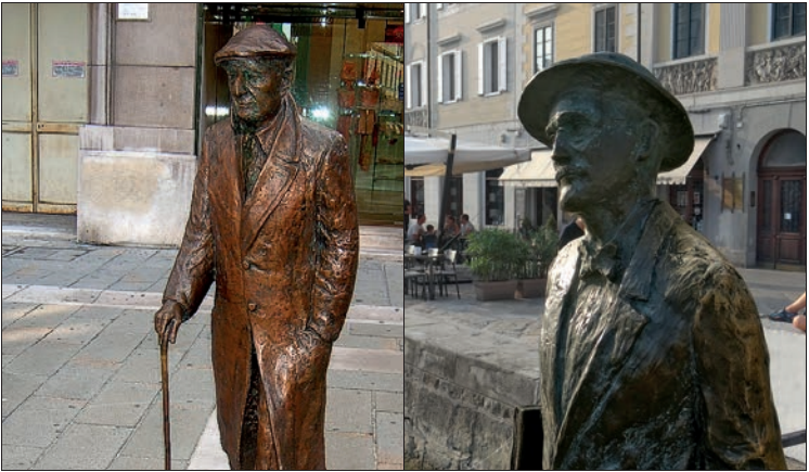
Umberto Saba und James Joyce in Triest