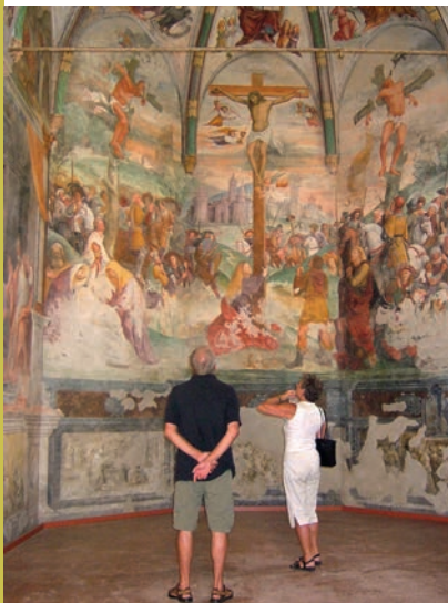
Fresko von Pellegrino da San Daniele in der Kirche Sant'Antonio Abate (San Daniele del Friuli)

von San Daniele ist ein einzigartiger Freskenzyklus erhalten, der als bedeutendster im Friaul angesehen wird. Er entstand im Laufe vieler Jahre, wobei sich Pellegrinos Stil mehrfach änderte, was sich an den Bildwerken in Sant'Antonio Abate gut erkennen lässt.