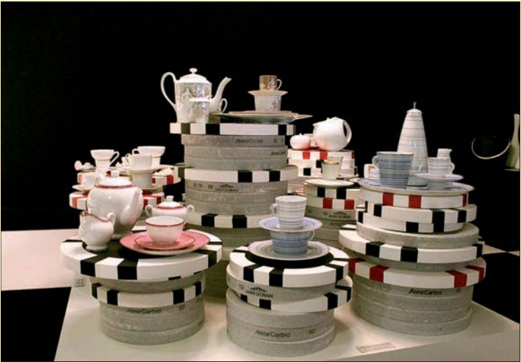
Porzellanausstellung im Rathaus

stäbe etc. waren mit Email verziert. Die Limosiner Emailkunst erlangte in dieser Zeit einen guten Ruf weit über die Landesgrenzen hinaus. Weg von den religiösen und hin zu profanen Motiven ging es während der Renaissance. Es entstand – und hier war Limoges quasi pinsel führend – die Emailmalerei. Beliebt und typisch für das Limousin war Grisaille-Email, Bilder in Grau, Schwarz und Weiß. Gemalt wurden vorwiegend antik-mythologische und ländliche Szenen. Der bekannteste Künstler zu dieser Zeit war Léonard Limosin. Später und bis ins 18. Jh. erlebte die Schmelz- und Malkunst eine lange Flaute. Erst in der Jugendstil- und Art-déco-Zeit erfuhr das Handwerk wieder einen Aufschwung. Noch heute sind Künstler mit ihren Ateliers in und um Limoges angesiedelt. Neben traditionellen Arbeiten fertigen sie modernen Schmuck und hübsche Accessoires an.