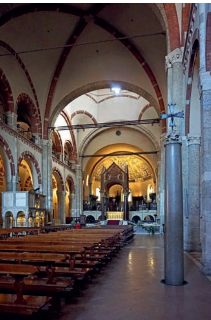
Eine der ältesten Kirchen der Stadt: Sant'Ambrogio

Die antike Basilica Martyrum wurde in den Jahren 379 bis 386 auf Wunsch des Bischofs der Stadt, Ambrosius, errichtet, dessen Gebeine in einem gläsernen Sarg in der Krypta der Kirche (397) beigesetzt sind, zwischen den Märtyrern Gervasius und Protasius. Die ursprüngliche Struktur mit drei Kirchenschiffen, zwei Säulenreihen und einer Apsis wurde vom 9. bis 12. Jh. grundlegend umgestaltet, trotzdem ist die Basilica eines der bedeutendsten und besterhaltenen Beispiele der Frühromanik in Italien. Im Inneren sind großartige Kunstwerke ausgestellt: der goldene, von Vilvinio geschaffene Altar (etwa 835) mit Reliefdarstellungen aus dem Leben Christi und des heiligen Ambrosius, im Chor tragen vier antike Porphyrsäulen das Ziborium (9. Jh.), die goldenen Mosaik in der Apsis aus dem 5. Jh. fesseln den Blick und in der Kapelle San Vittorio in Ciel d'Oro kann man das einzige authentische Bild des heiligen Ambrogio bestaunen. Ungewöhnlich ist die bronzene „Schlange von Moses“ auf einer Granitsäule im Mittelschiff, der Legende nach von Moses geschmiedet.