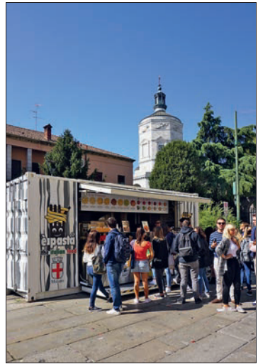
Pasta-Take-Away vor der Uni Cattolica

Officina Profumo Santa Maria Novella 4 , eine alte Apotheke aus Florenz, in der man z. B. Lavendelsalz, Melissenwasser-Elixier oder Pas-