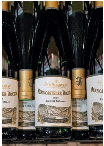
Der edelste und teuerste unter den Moselweinen

Seit einigen Jahren vollzieht sich ein Generationenwechsel im Weinbau. Junge Winzerinnen und Winzer widmen sich trotz der mühsamen Handarbeit wieder verstärkt dem Steillagenanbau, um hochwertige Weine zu erzeugen. Dabei rücken Nachhaltigkeit und Biodiversität immer stärker in den Fokus. Immer mehr Weingüter setzen auf ökologischen Weinbau. Statt klassischer chemischer Pestizide verwenden sie chemiefreie Methoden: sparsam eingesetztes Kupfer und Schwefel gegen echten und falschen Mehltau, Algenpräparate gegen Pilze sowie Nützlinge wie Schlupfwespen oder Raubmilben zur natürlichen Schädlingsbekämpfung. Außerdem werden zunehmend pilzwiderstandsfähige Sorten – sog. PIWI-