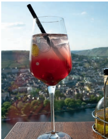
Der Mosel-Cocktail schlechthin: Mosel-Spritz

Wer keinen Alkohol trinken möchte, findet im Traubensaft der Winzer eine hervorragende Alternative, entweder pur oder als Schorle. Mit Supermarkt-Traubensaft hat das nichts zu tun, deshalb gibt es auch eine Besonderheit: Am Glasboden setzt sich manchmal sog. Weinstein ab – Weinsäurekristalle, die