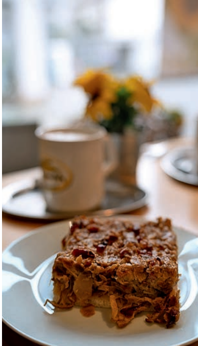
Der Klassiker: Zwiebelkuchen ▲ Vesperplatte ▼

Nicht alle Lokale akzeptieren Kartenzahlung, deshalb ist es sinnvoll, stets etwas Bargeld dabei zu haben.