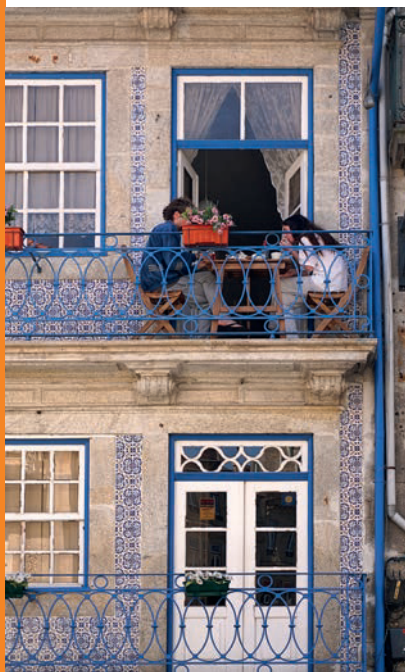
Frühstücken wie zu Hause

Camping Angeiras (Orbitur), im Fischerdorf Angeiras, nördlich vom Hafentort Matosinhos. Ein Plankenweg führt an einem Bach entlang zum 400 m entfernten, schönen Strand. Zudem grenzt ein öffentliches Schwimmbad direkt an den Platz. Teilweise Schatten, auch ältere Holzbangalows werden vermietet. Bis nach Porto sind es ca. 20 km. Busstop am Platz. Rua de Angeiras, ☎ 229-270571, www.orbitur.com .