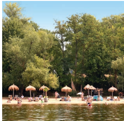
Lässigstes Strandbad rund um Potsdam: Strandbad Caputh

Badeplatz am Heiligen See , → Karte S. 62/63, am Nordostufer des Sees mitten im Weltkulturerbe vor der Kulisse des Marmorpalais. Familien, Kinder, Jugendliche und auch Promis aus den umliegenden Villen zieht es zu dieser Badestelle an dem nur 8 m tiefen Gewässer. Fast 300 m langer Badebereich mit