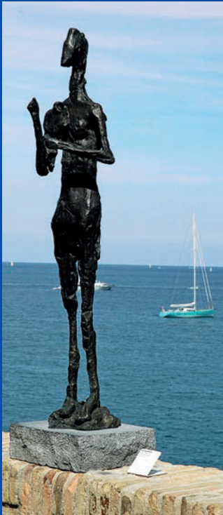
Skulpturen im Picasso-Museum in Antibes

Wohl keine andere Küstenregion der Welt übt seit mehr als zwei Jahrhunderten unverändert eine auch nur annähernd so starke Anziehungskraft auf Reisende jeder Couleur aus wie die Côte d'Azur. Städte wie Monaco, Nizza, Saint-Tropez und Cassis sind absolute touristische Highlights in Südfrankreich.