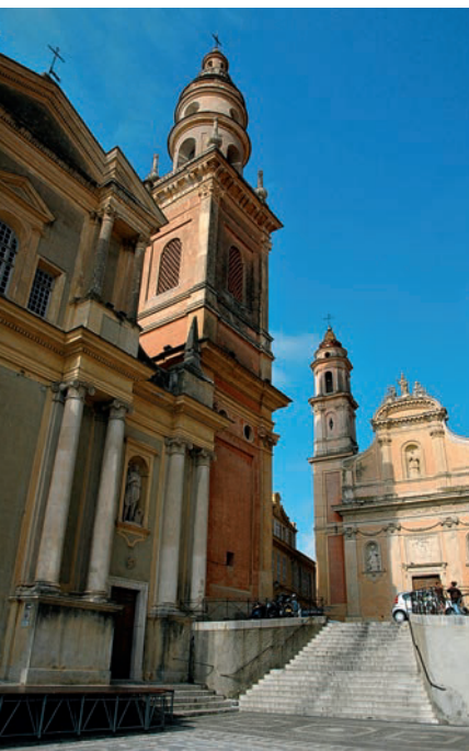
Die Kathedrale von Menton

Im letzten Drittel des 19. Jahrhunderts setzte sich bei englischen Ärzten die Ansicht durch, dass das ausgesprochen milde Klima von Menton nicht nur für Zitronen- und Orangenbäume geeignet sei, sondern auch die unter dem Londoner Nebel leidenden jungen Damen zum „Blühen bringe“. Doch unterschied sich der Tourismus in Menton deutlich von dem der anderen Metropolen der Côte d'Azur: Da Menton erst 1884 einen Anschluss an das Eisenbahnnetz erhielt, wurde die Stadt relativ spät zu einem Refugium der Reichen, doch handelte es sich genau betrachtet zumeist um diejenigen Reichen, die nicht wohlhabend genug waren, sich ein repräsentatives Leben in Cannes oder Monaco zu leisten. Während des Ersten Weltkriegs wurde das für die Heilung Kranker bekannte Menton zu einem überdimensionalen Erholungszentrum für kriegsverwundete Soldaten; allerdings nur für die oberen Ränge, denn Menton galt als station élé-