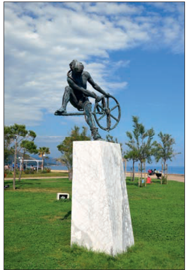
Ulysses-Skulptur an der Promenade

Jardin du Palais Carnolès: Der Garten der ehemaligen Sommerresidenz der