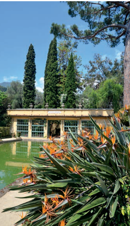
La Serre de la Madone

■ 21, promenade Reine Astrid. Führungen Di um 10 Uhr. Eintritt 5 €.