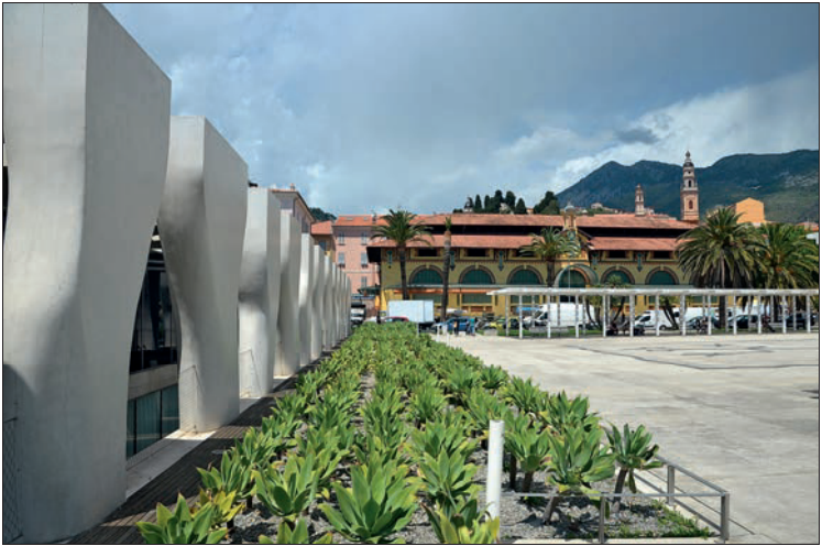
Futuristisch: Musée Jean Cocteau

gante. Bei einfachen Soldaten hingegen, die sogar aus Menton stammten, lehnte man den Wunsch nach einem Genesungsaufenthalt in ihrer Heimatstadt mit der Begründung ab, sie könnten sich ja anderswo in Frankreich erholen.