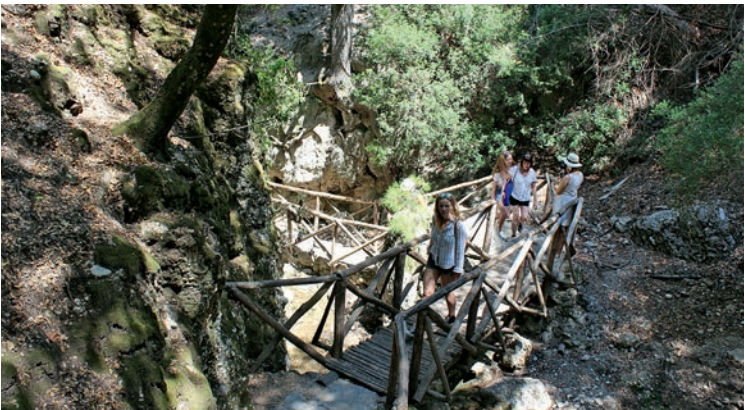
Auf Treppen geht es durch das Tal der Schmetterlinge bergauf

Das wasserreiche, ca. 1,5 km lange Areal mit seinen knorrigen Bäumen ist im höchsten Maß gefährdet. Die „Karriere“ von Petaloudes begann in den 1970er-Jahren. Damals klatschten Führer noch in die Hände oder benutzten Pfeifen, um die Schmetterlinge aufzuschrecken, damit die Besucher sie fotografieren konnten. 1984 war es so weit, dass die Population vom Aussterben bedroht war. In einem biologischen Forschungsprojekt wurde nachgewiesen, dass Lärm eine der Hauptursachen der Populationsminderung im Schmetterlingstal ist. Daraufhin wurden entsprechende Schutzmaßnahmen eingeleitet, die vor einigen Jahren noch verschärft wurden.