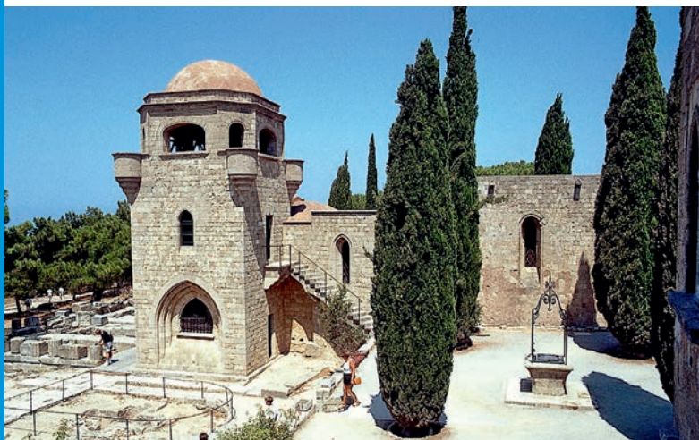
Die Italiener bauten Filérimos wieder auf