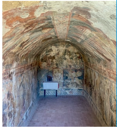
Höhlenkirche des heiligen Georg

Byzantinische Festung 4: Eine Kiefernallee führt zur Festung. Das strategisch günstig gelegene Bergplateau Filérimos war in byzantinischer Zeit von Mauern umgeben. Wichtigstes Relikt aus dieser Zeit ist die Zitadelle (13. Jh.) im Osten des Plateaus. Die Türken richteten einst