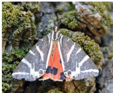
Die Quadriga-Schmetterlinge locken jährlich 200.000 Besucher

In der Saison herrscht im Tal der Schmetterlinge allerdings auch menschlicher Massenandrang, dann kann es an manchen Stellen des schmalen, schattigen Pfads schon mal eng werden. Daher lohnt es sich, früh aufzustehen und