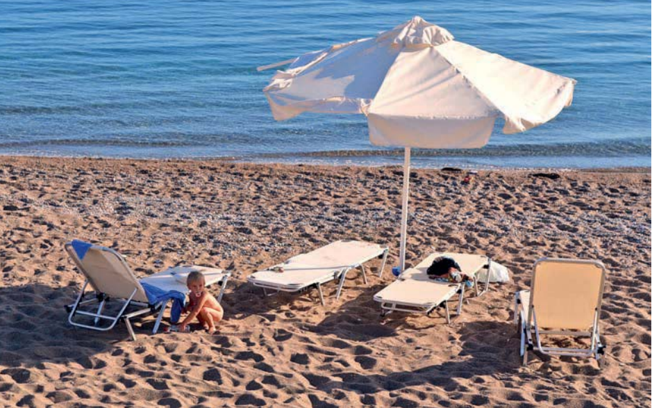
Am Strand von Charáki