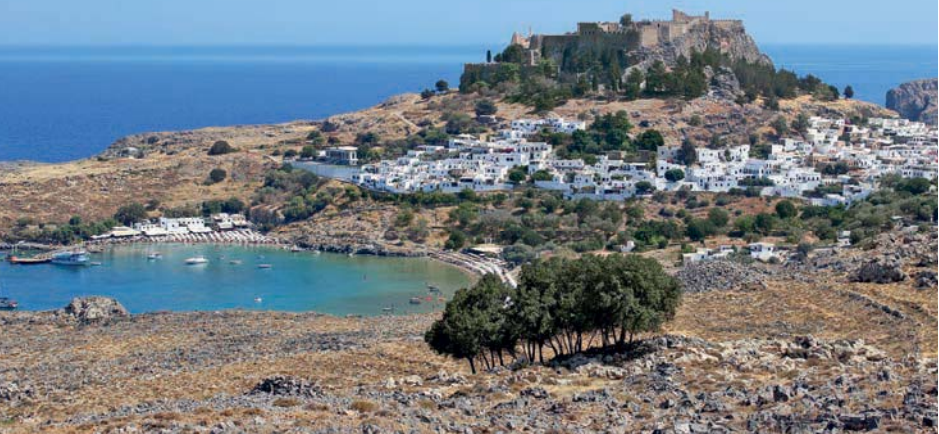
Panorama-Blick auf Lindos