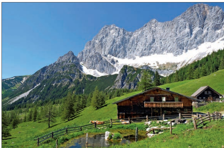
Paradeblick von der Neustattalm auf den Dachstein