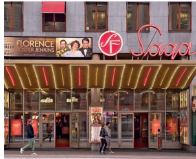
Kinos zeigen Filme in der Originalfassung

Bio Rio , das 1943 eröffnete, unabhängige Einzelkino auf Södermalm zeigt aktuelle Filme aus