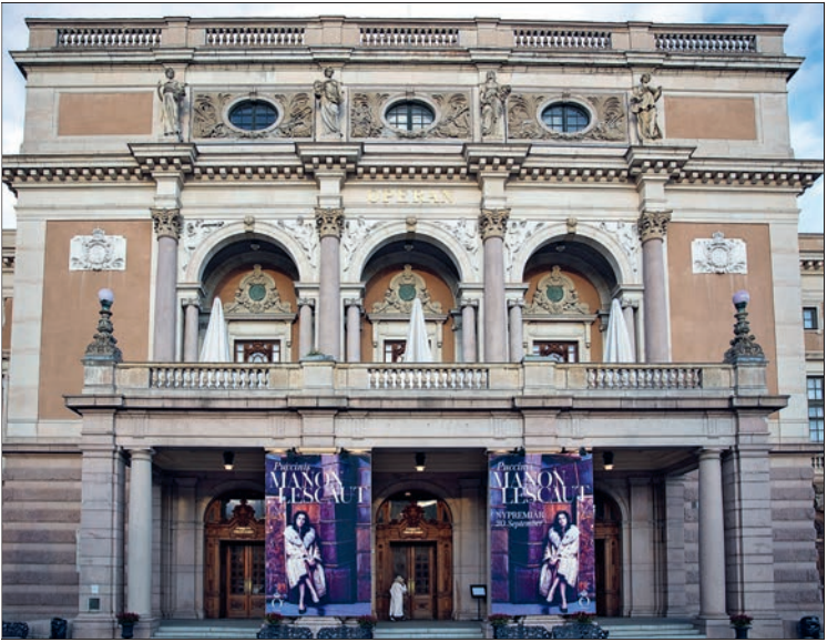
Die Königliche Oper zeigt klassisch und modern inszenierte Werke