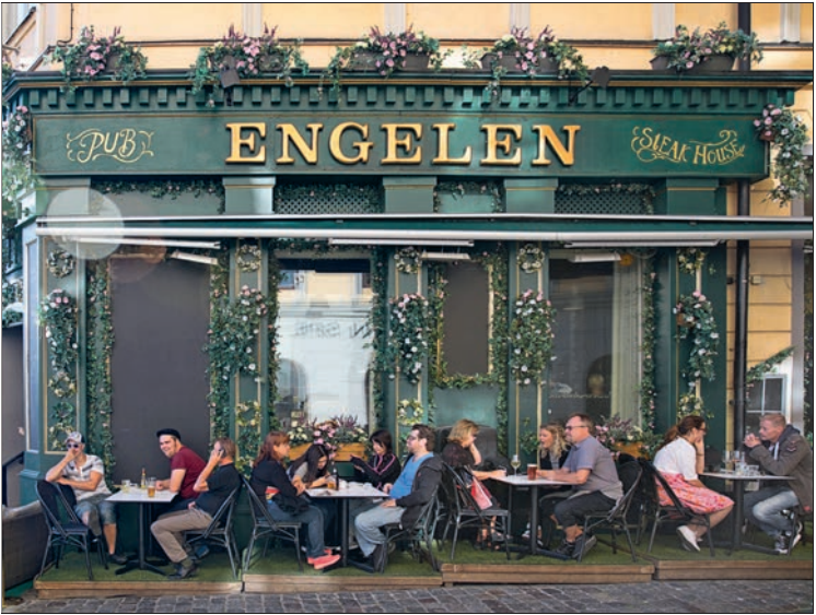
Restaurant, Pub und Nachtclub in einem

kein Eintritt, Mindestalter ist 23 Jahre. Stilsicherheit beweisen Stockholmer natürlich auch beim Ausgehen, und ein gepflegtes bis schickes Auftreten mit Hemd für die Herren und Kleid für die Damen ist zu empfehlen.