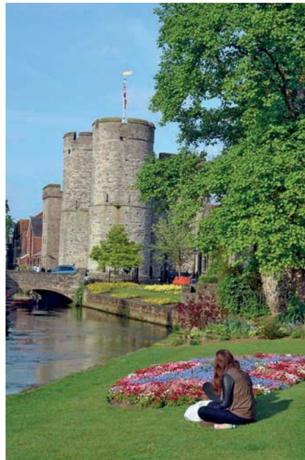
Kurze Pause beim West Gate

St Augustine's Abbey: Nur einige hundert Meter östlich der Kathedrale, aber außerhalb der Stadtmauer, befindet sich die Ruine der St Augustine's Ab-