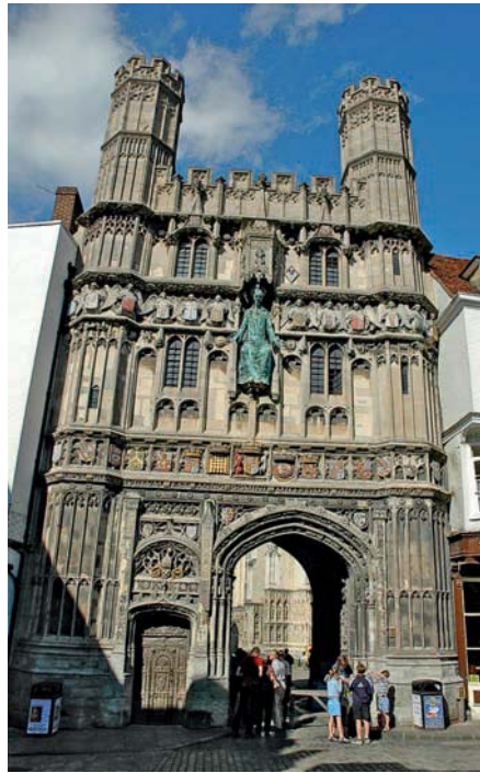
Canterburys Christ Church Gate – das Tor zur Domfreiheit

Christ Church Gate: Das als Haupteingang zur Domfreiheit ( Cathedral Precinct ) dienende Christ Church Gate ist ein architektonisches Prunkstück, verziert mit himmlischen Heerscharen und den bunten Wappensteinen der Kirchen-