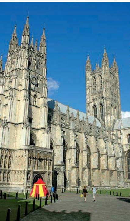
Beeindruckend: die Kathedrale von Canterbury

The Coach House 20 Sechs große, helle Zimmer mit TV. Zu jedem Zimmer gehört ein ei-