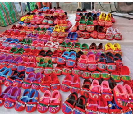
Handgemachte Schuhe auf der Walking Street

John Gallery 27 , fällt sofort ins Auge. Der Künstler, ein waschechter Chiangmaier, arbeitet viel mit Holz, so z. B. Windspiele und Vogelhäuser, aber auch Skulpturen aus Wurzelwerk stellt er aus. Seine Bilder sind grell und groß –