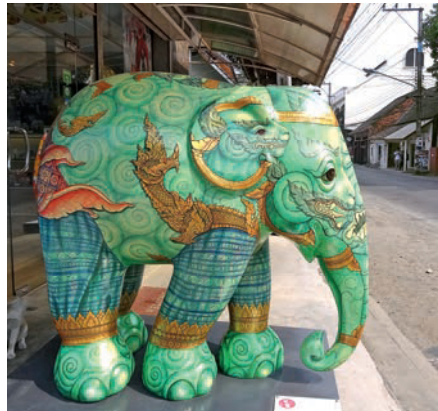
Eingang zum Elephant Parade Shop in Wat Ket

Wechselstuben Super Rich 22 (→ S. 32), guter Kurs. Ratviti Rd., Soi 1, www.superrichchiangmai.com.