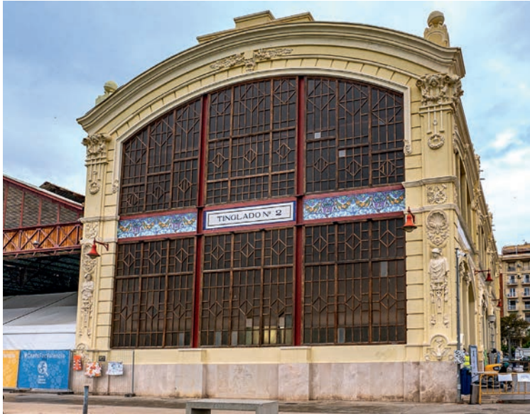
Tinglado im Hafen Valencias

Das 1916 ebenfalls im Stil des Modernisme errichtete „Uhrengebäude“, das Edificio del Reloj (val. Edifici del Rellotge), frü-