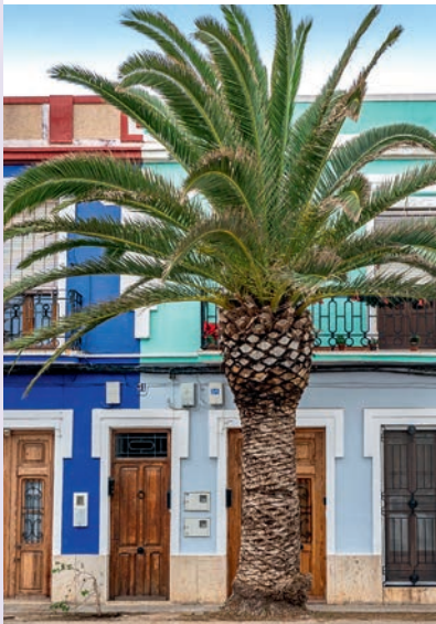
Bunte Promenade der Playa de Cabañal

Mercado Municipal de Cabañal 6 , Markthalle, in der frisches Obst und Gemüse aus dem Umland, fangfrischer Fisch, Nüsse und Gewürze, aber auch Kleidung und Drogerieartikel angeboten werden, außerdem gibt es eine kleine Bar. Mo–Sa 7–14.30 Uhr. Calle Martí Grajales 4, mercadocabanyal.es.