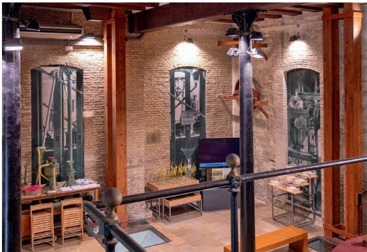
Anschaulich: das Reismuseum

Das Chalet de Vicente Blasco Ibáñez, wie der am Strand von Malvarrosa gelegene Palast im Volksmund genannt wird,