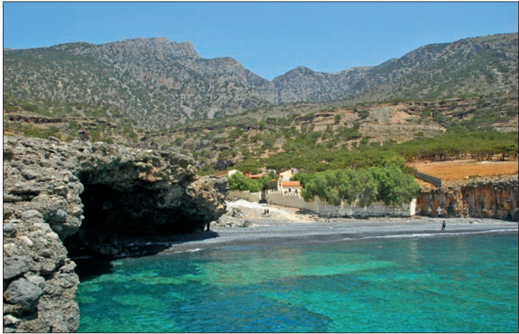
Idyllische Lage: Kloster Koudoumá unterhalb von Kapetanianá

lichkeit bietet der abgelegene Strand von Ágios Ioánnis, mit dem Auto in etwa 25 Min. über eine Schotterstraße zu erreichen.