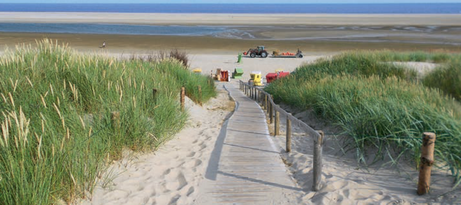
Einmal über die Dünen: Strandzugang Langeoog