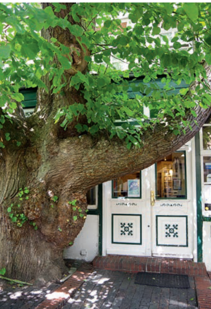
Uralt: Insellinde Spiekeroog

MeinTipp Old Laramie – Café Westend 5 , das etwas verwegen aussehende Gebäude an der Endstation der Pferdebahn Geschichte. Es war ehemals die Warmbadeanstalt Spiekeroogs (1899) und bis 1945 das Flughafengebäude. Mittags kann man auf der etwas skurrilen Terrasse Kaffee und Kuchen genießen. Gläser gibt es nicht: Limo oder Cola trinkt man einfach aus der Flasche. Tagsüber ein nettes Ausflugsziel für eine Strandwanderung; abends wird die unkomplizierte Kneipe mit Kultcharakter zum einzigen Tanzschuppen der Insel. Tägl. 13–17 und ab 21 Uhr geöffnet (Mo Ruhetag). Westend 5, ☎ 04976-318.